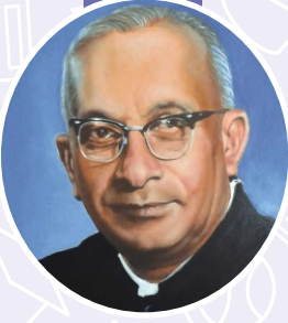
स्व. कर्मवीर दादासाहेब कन्नमवार माजी मुख्यमंत्री, महाराष्ट्र राज्य